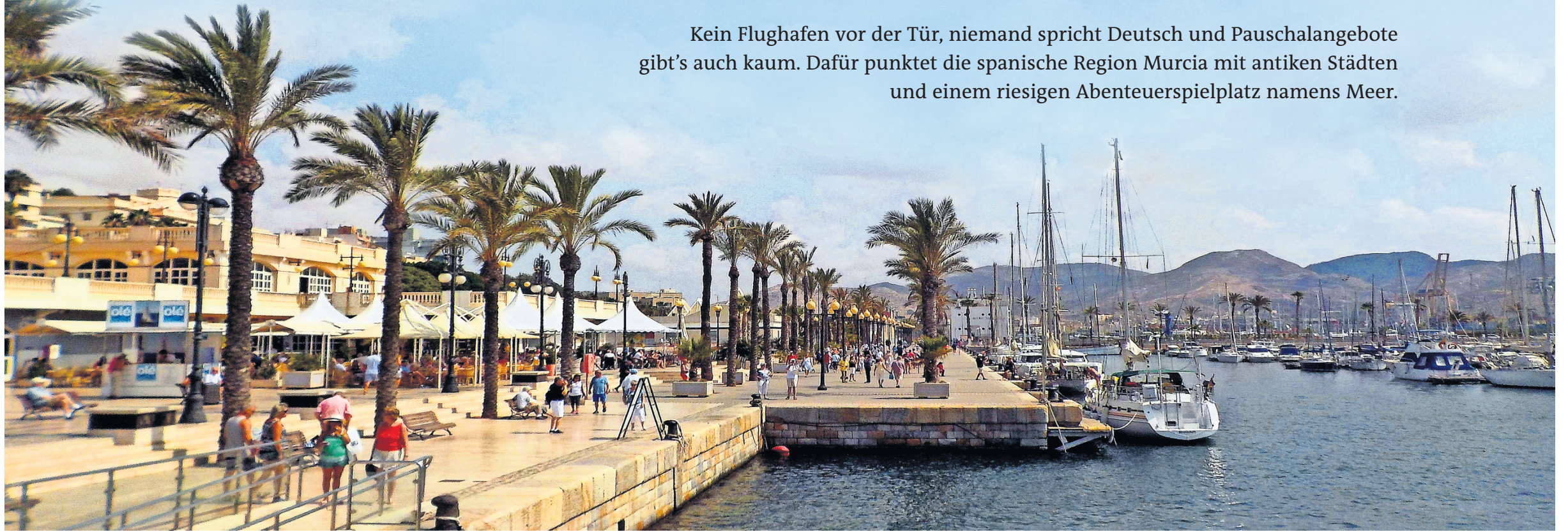
Am palmengesäumten Hafen von Cartagena ist immer viel los.

Kein Flughafen vor der Tür, niemand spricht Deutsch und Pauschalangebote gibt's auch kaum. Dafür punktet die spanische Region Murcia mit antiken Städten und einem riesigen Abenteuerspielplatz namens Meer.